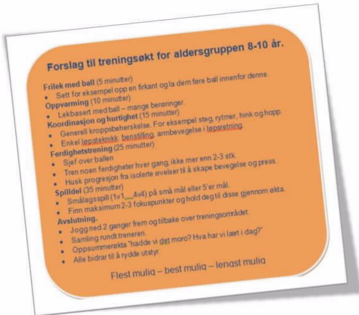
Tabell 4 - Eksempel på treningsøkt 8-10 åringer