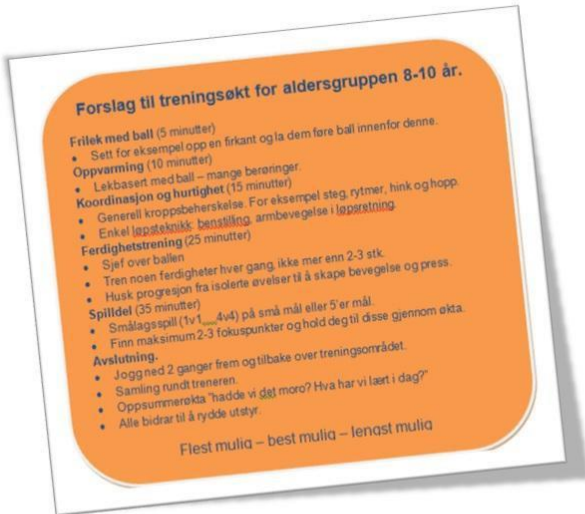
Tabell 4 - Eksempel på treningsøkt 8-10 åringer

http://xitepro.com/customer/935120/default.asp?layout=article&id=71